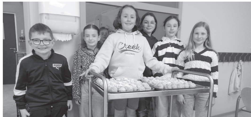
Les anniversaires du mois de mars 2026 ont été fêtés au restaurant scolaire.